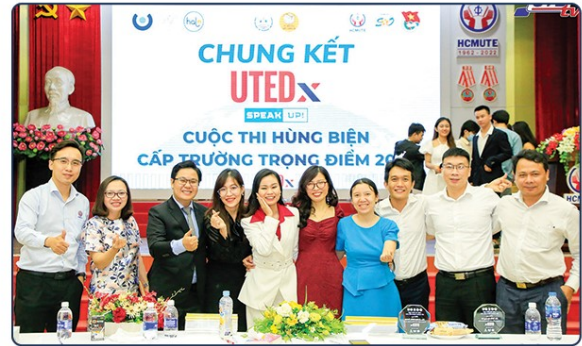
Halo Language Center hân hạnh là Nhà Tài trợ Vàng cho Cuộc thi hùng biện UTEDx năm 202 do Khoa Kinh tế thuộc Trường Đại học Sư phạm Kỹ thuật TP. HCM tổ chức