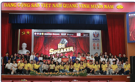
Halo Language Center hân hạnh đồng hành cùng cuộc thi "BE SPEAKER mùa 3 2024" do CLB BECUTE - CLB Anh văn Thương mại trực thuộc Khoa Kinh tế Trường Đại học Sư phạm Kỹ thuật TP. HCM tổ chức