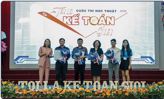
Halo Language Center hân hạnh là Nhà Tài trợ Vàng cho Cuộc thi học thuật Toll là Kế toán giỏi lần V năm 2024 do Khoa Kinh tế thuộc Trường Đại học Sư phạm Kỹ thuật TP. HCM tổ chức