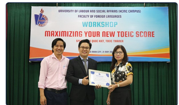
Halo Language Center hân hạnh là đơn vị chia sẻ tại Workshop Maximizing Your New TOEIC Score do Trường Đại học Lao động - Xã hội (CS II) tổ chức