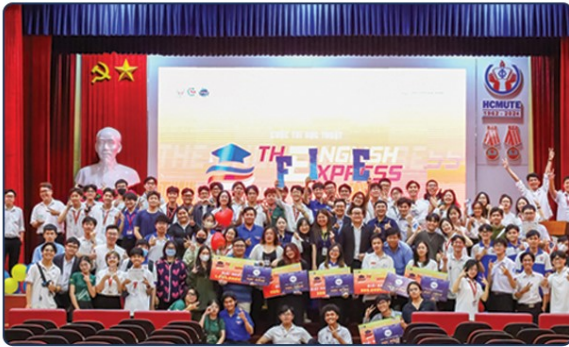
Halo Language Center hân hạnh là Nhà Tài trợ và Cố vấn chuyên môn cho Cuộc thi học thuật The English Express do Khoa Đào tạo Quốc tế thuộc Trường Đại học Sư phạm Kỹ thuật TP. HCM tổ chức